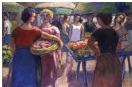
Louis Audibert, peinture : Les Porteurs d'oranges.

occidentale sont mises en valeur. La campagne provençale n'est pas oubliée pour autant ; Provence urbaine et Provence rurale n'étant que deux aspects d'une Provence unifiée.