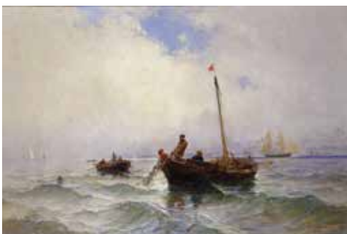
Paul Bistagne : Pêcheurs au large de l'Estaque.

De Marseille à Toulon, d'Avignon à Aix-en-Provence, les principales villes de la Provence